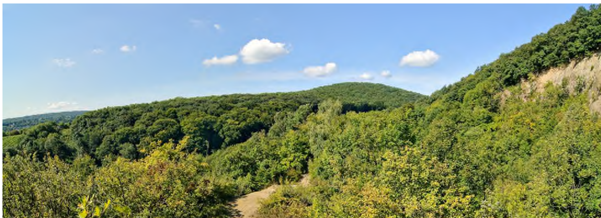
Das Gebiet um den Sieveringer Steinbruch. © Adolf Schatten.