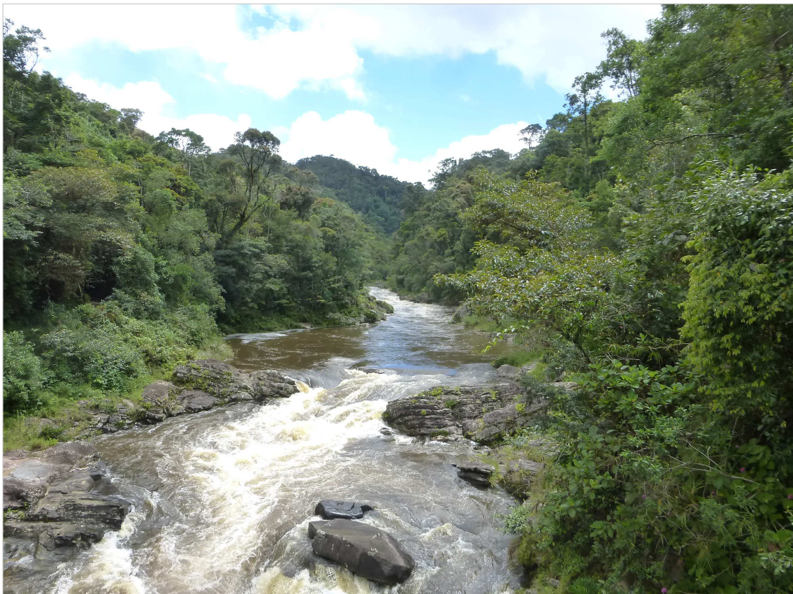
Der Ranomafana-Fluss hat dem Nationalpark den Namen gegeben.