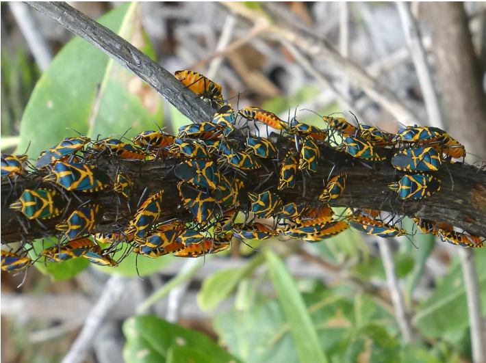
Stinkwanzenkolonie ( Agaeus bicolor , Pentatomidae) im Trockenwald des Isalo-Nationalparks.