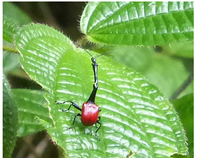
Giraffenhalskäfer ( Trachelophorus giraffa ) im Ranomafana-Nationalpark. © Alexander Dostal.