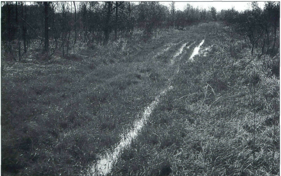
Abb. 2: Der besonders nasse Teil im Zentrum des Untersuchungsgebietes am 24. April 1999, Blick Richtung Osten.