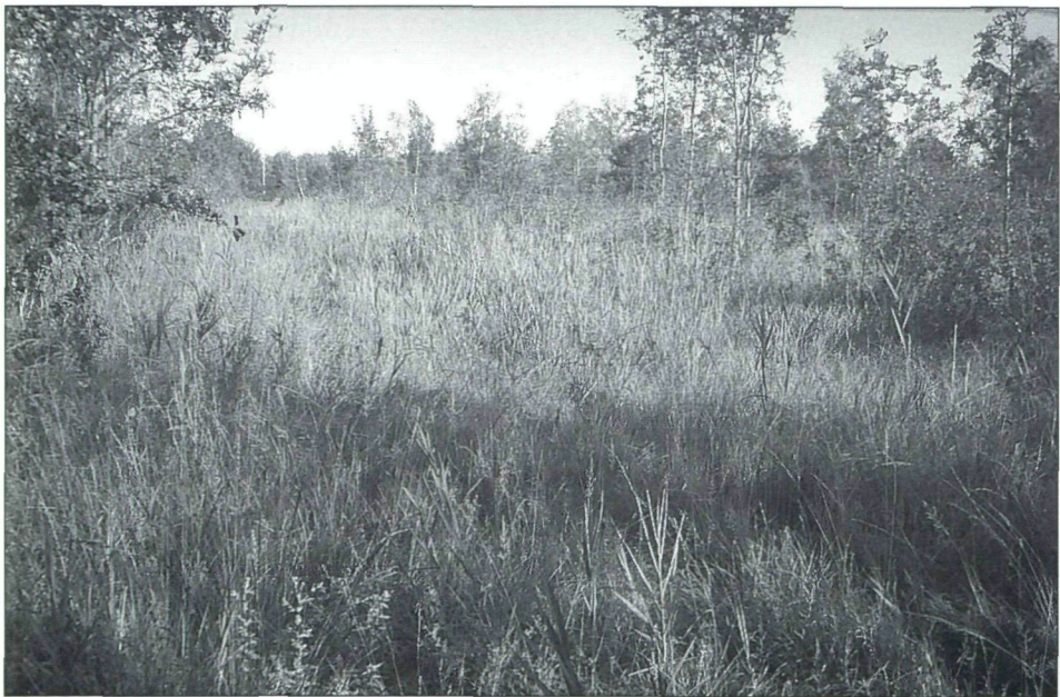
Abb. 4: Im Zentrum des Untersuchungsgebietes am 12.8.1998, Blick Richtung Süden.