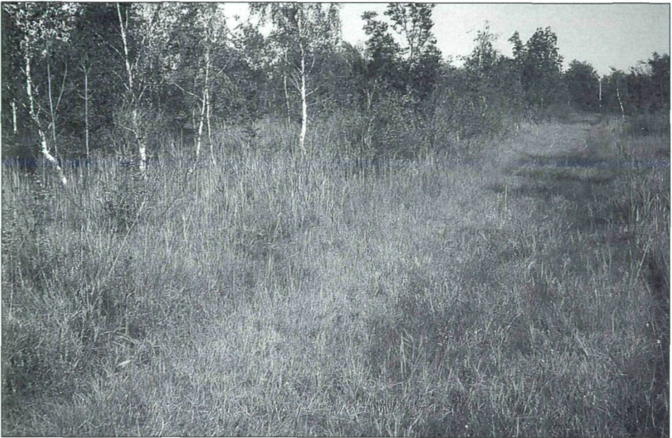
Abb. 3: Im Zentrum des Untersuchungsgebietes am 12.8.1998, Blick Richtung Westen.