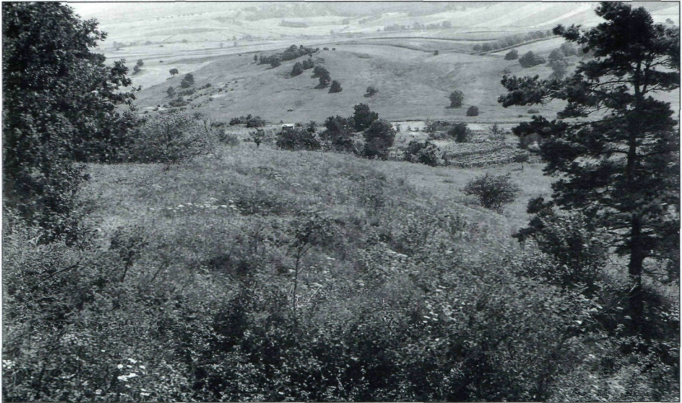
Abb. 2.: Blick vom Rohrbacher Kogel Richtung Rohrbach