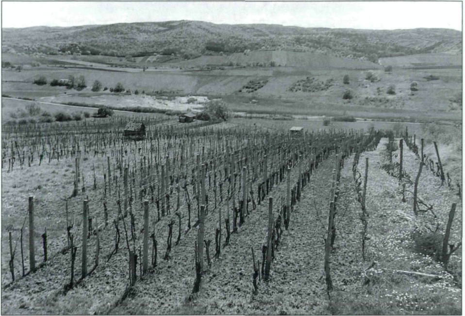
Abb. 3.: Naturschutzgebiet Rohrbacher Teichwiesen