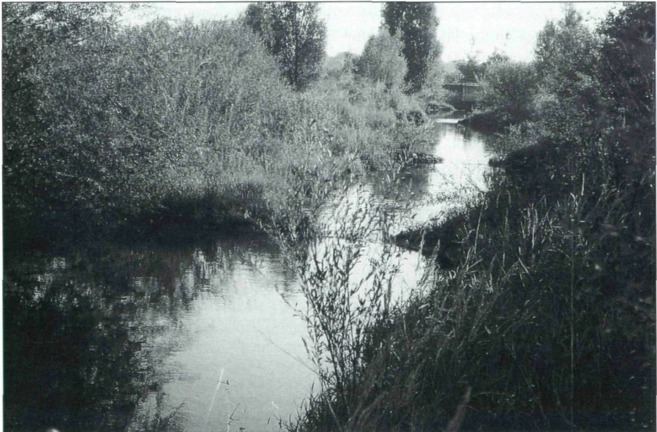
Abb.3: Nebengerinne des Marchfeldkanals bei Deutsch Wagram.