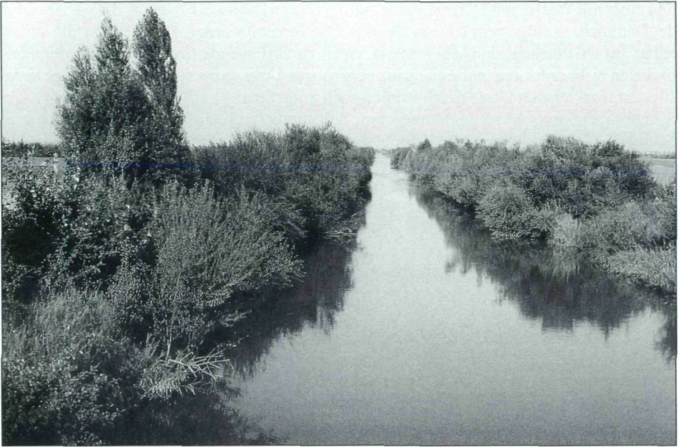
Abb. 2: Hauptgerinne des Marchfeldkanals bei Deutsch Wagram.