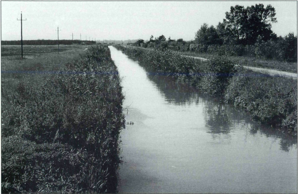
Abb.4: Wiener Neustädter Kanal bei Eggendorf.