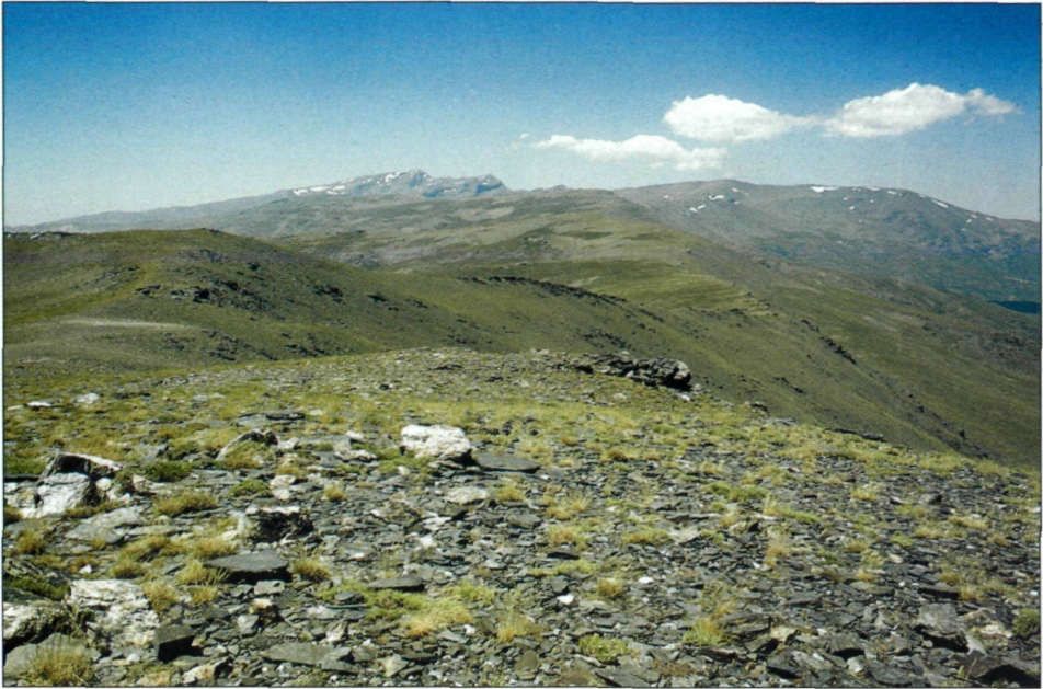
Abb. 2. Locus typicus von S. kautzi ♂, San Juan, Blick vom Gipfel (2784 m) nach Westen.