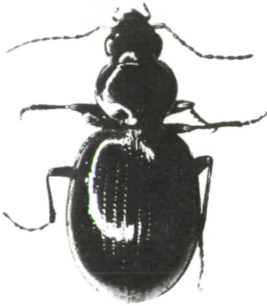
Abb.2: Löffleria globicollis n.gen. n.sp.♀ (Holotypus) 10x nat.Gr. Nord-Borneo, 3500 m, 2.III.1969, leg. Dr.H.Löffler