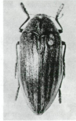
Fig. 2. Julodis onopordi ssp. mandli ssp.n.

Fleck, das zweite, dritte und vierte Sternit mit einem feinen, orange behaarten Fleck, und das letzte mit zwei nebeneinander stehenden, dreieckig geformten Haarflecken, dazwischen am Ende eine M-förmige, dunkelbraune Zeichnung. Der Fortsatz des Mesosternums spitz nach vorne gerichtet; die Schenkel sämtlicher Beine an der Innenseite schwarz und an der Außenseite braun.