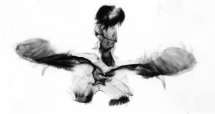
Abb. 4. Exelastis phlyctaenias (MEYRICK, 1911). Männliches Genitale. GU 6336 ♂ Ar.

Material: 1 ♂: S. Oman, W from Salalah, 20 km W from Al Mughsayl, 640 m, slopes to Arabian Sea (Camels), 8. – 24. 7. 2007, Krueger, Saldaitis leg. – 1 ♂, 1 ♀: S. Oman, Dhofar, Wadi Razat, 770 m, 21. 9. 2006.