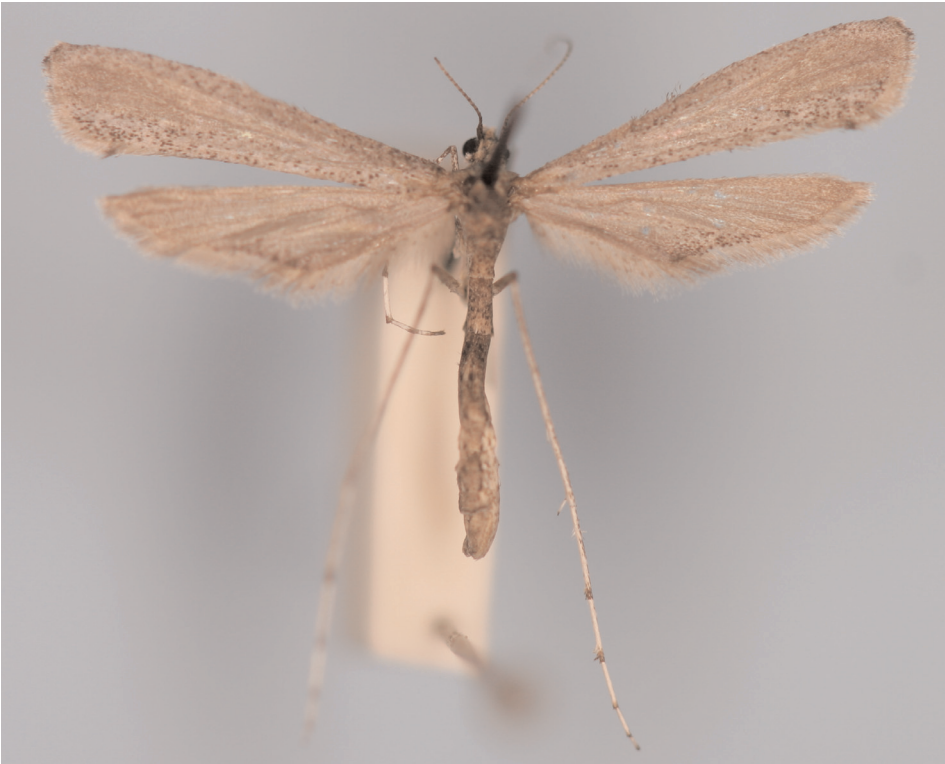
Abb. 1. Agdistis omani sp. n.