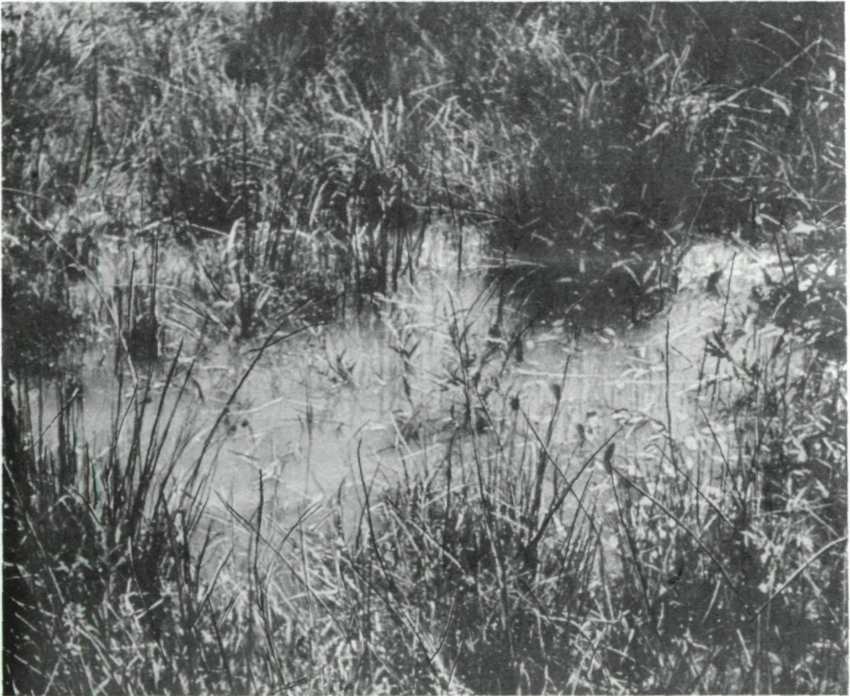
Abb. 1: Bewässerungsgraben bei Corbii-Ciungi.

2 ♂♂ und 1 ♀ wurden am 19. Juli 1959 eingefangen, als ich mit dem Netz zwischen den Pflanzen am Ufer eines Bewässerungsgrabens nahe der Quellgruppe Corbii Ciungi, 40 Kilometer westlich Bukarest, strich. Einige Dutzend ♂♂ und ♀♀ wurden aus Puppen von Hydropota griseola gezüchtet, welche letztere im Winter 1957-1958 bei Ghencea (perennierende Tümpel im Weichbild von Bukarest) gesammelt wurden.