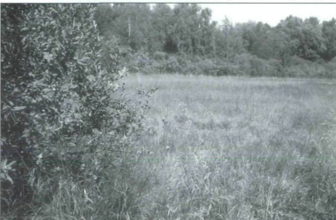
Abb. 5: Seiherwiese IV, am 12.8.1998, NW-Hälfte, Blick von der Seiherwiese IIIb Richtung Norden.