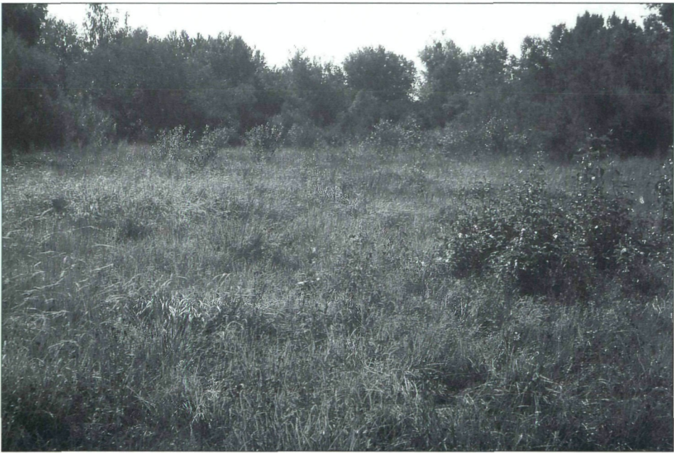
Abb. 2: Seiherrwiese I, am 12.8.1998, NW-Ecke.