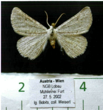
Abb. 1: Dyscia raunaria aus der Lobau, ♂.

Rechts Abb. 2: Dyscia raunaria männliches Genital (GU 1022/2005 FW).