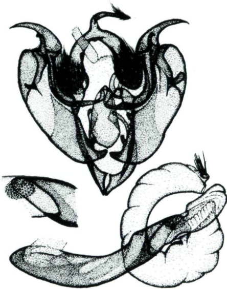
Abb. 7: Genital ♂, Lacanobia (Dianobia) mista (STAUDINGER, 1889) Holotypus