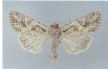
Abb. 6: Lacanobia (Dianobia) mista (STAUDINGER, 1889) ♀