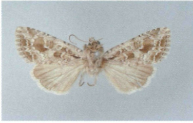
Abb. 5: Lacanobia (Dianobia) mista (STAUDINGER, 1889) Typus ♂