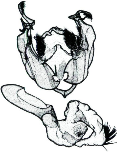
Abb. 3: Genital ♂, Lacanobia (Diataraxia) hreblayi sp. n., Holotypus