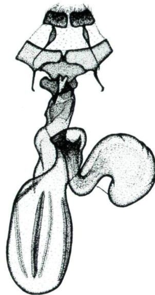
Abb. 8: Genital ♀, Lacanobia (Dianobia) mista (STAUDINGER, 1889)