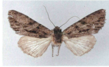
Abb. 2: Lacanobia (Diataraxia) hreblayi sp. n., Paratypus ♀