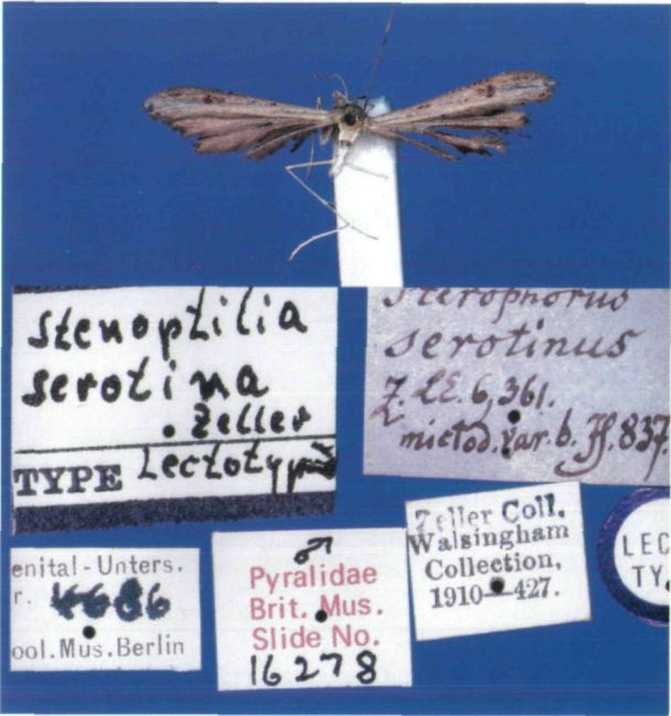
Abb. 1: Stenoptilia serotina (ZELLER, 1852). Typus.