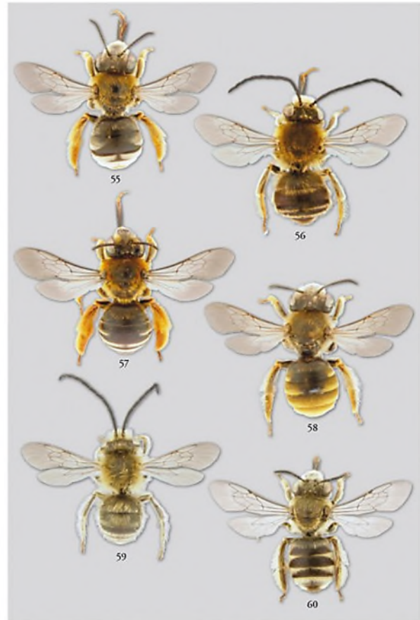
Plate 50. 55-56. Eucera (Heterocera) clypeata female and male. 57. Eucera (Heterocera) collaris female. 58-59. Eucera (Heterocera) vulpes female and male. 60. Tetraloniella (Tetraloniella) nana female.