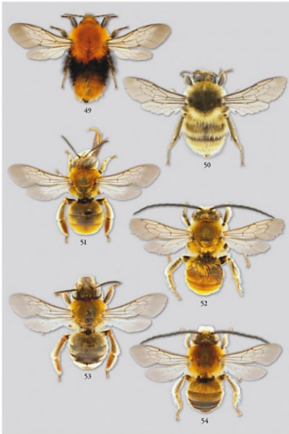
Plate 49. 49. Bombus (Thoracobombus) pascuorum sparreanus queen. 50. Bombus (Thoracobombus) sylvarum queen. 51-52. Eucera (Eucera) chrysoptera female and male. 53-54. Eucera (Eucera) nigrescens female and male.