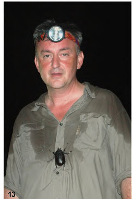
Abb. 11–13: Unterwegs in Südamerika: (11) in den peruanischen Anden, am Colca-Canyon, Mai 2017; (12) in Patagonien (Süd-Chile) entlang der Carretera austral, mit Riesen Rhabarber ( Gunnera sp.), 2012; (13) Lichtfang in Französisch-Guayana, Oktober 2009.