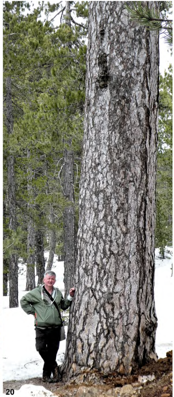
Abb. 18–20: Auf der Suche nach endemischen Laufkäfern: (18) am Gipfel des Monte Barone, Oberitalien, Juni 2010; (19) Gesiebeaussuche in der Sierra Estrella, Portugal, Mai 2018; (20) in Zypern, Troodos-Gebirge, Paphos Forest, Cedar Valley, mit jahrhundealter Kalabrischer Kiefer ( Pinus brutia ), März 2019.