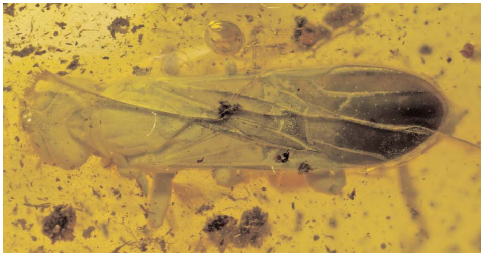
Abb. 1: Baltorussus velteni gen.n., sp.n., Holotypus, Dorsalansicht, Körperlänge = 9 mm (Foto: St. Heim).

Diskoidalzellen (Abb. 1, 2a) ist ganz anders als bei Orussus , wenn auch undeutlich erkennbar. Als trennendes Merkmal kann im Geäder auch die parallele Anordnung der 2. Cubital- zur apikalen Discoidalzelle angesehen werden. Der Austritt der Antennen unterhalb des Clypeus, wie er sonst bei den rezenten Orussidae klar erkennbar ist, ist bei Baltorussus mehr nach der Frons hin verlegt. Die Antennen zeigen keine Verdickung irgendeines Antennomers.