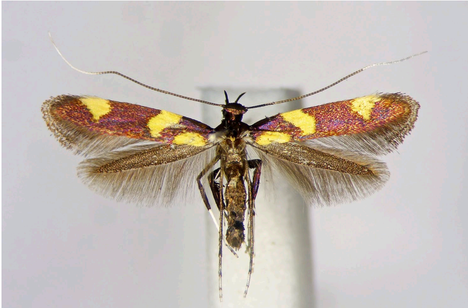
Abb. 1: Männchen von Caloptilia magnifica aus Arnoldstein, Kärnten (Spannweite = 12,5 mm).

für Österreich dar. Die nächsten uns bekannten Fundorte liegen in der Umgebung von Gemona, Friaul, Italien, wo wir die Minen und Raupen in den vergangenen Jahren an mehreren Stellen finden konnten.