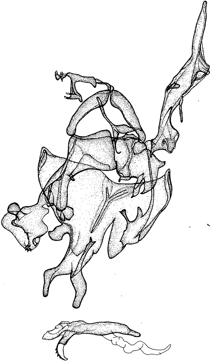
Abb. 1. Agdistis flavissima CARADJA, Holotypus ♂, „Chamil Hami, Tancre“. GU 3220 ♂ AR.