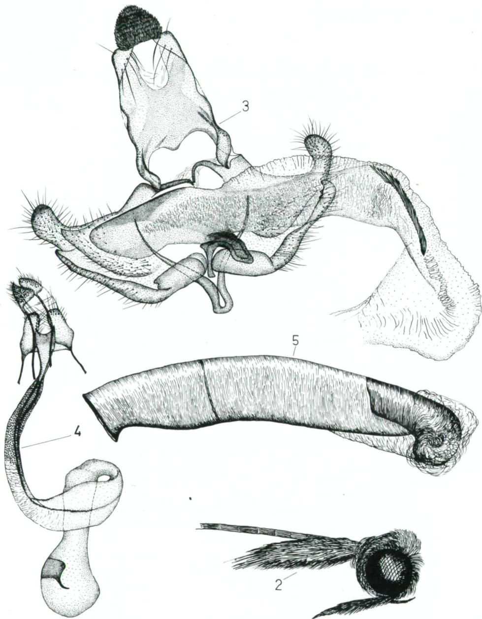
Abb.2-5: Coleophora arenbergeri n.sp. — 2: Kopf. — 3: Männlicher Genitalapparat, Holotypus, Asia min., Turcia, Karapinar (Versuchsgut), 995 m, leg. M.u.W.Glaser, GU.Nr.1808. — 4: Weiblicher Genitalapparat, Paratypus, gleicher Fundort, GU.Nr.1806. — 5: Raupensack.

und steht dort Coleophora (Multicoloria) tuvensis REZNIK sehr nahe, weitere Verwandte sind Coleophora perissa REZNIK und Coleophora mausolea REZNIK.