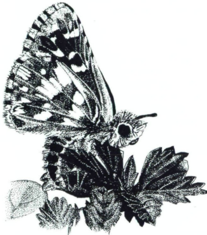
Abb. 3: Weibchen von Pyrgus armoricanus bei der Eiablage an Potentilla erecta, am 29.08.1996 im Bundesland Salzburg beobachtet.